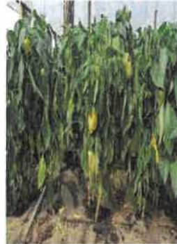
ofilirea vasculara ardei(fuzarioza)