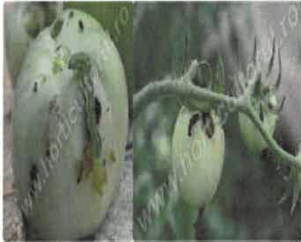
Omida fructificatiilor Tomate